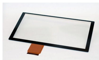
FID-155シリーズタッチパネル (加飾印刷コントロールIC 無し品)