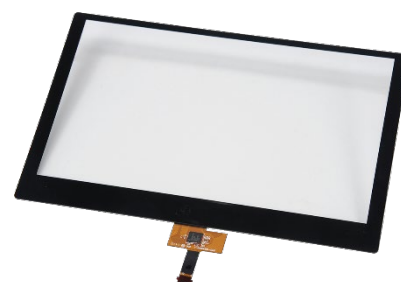
FID-154シリーズタッチパネル